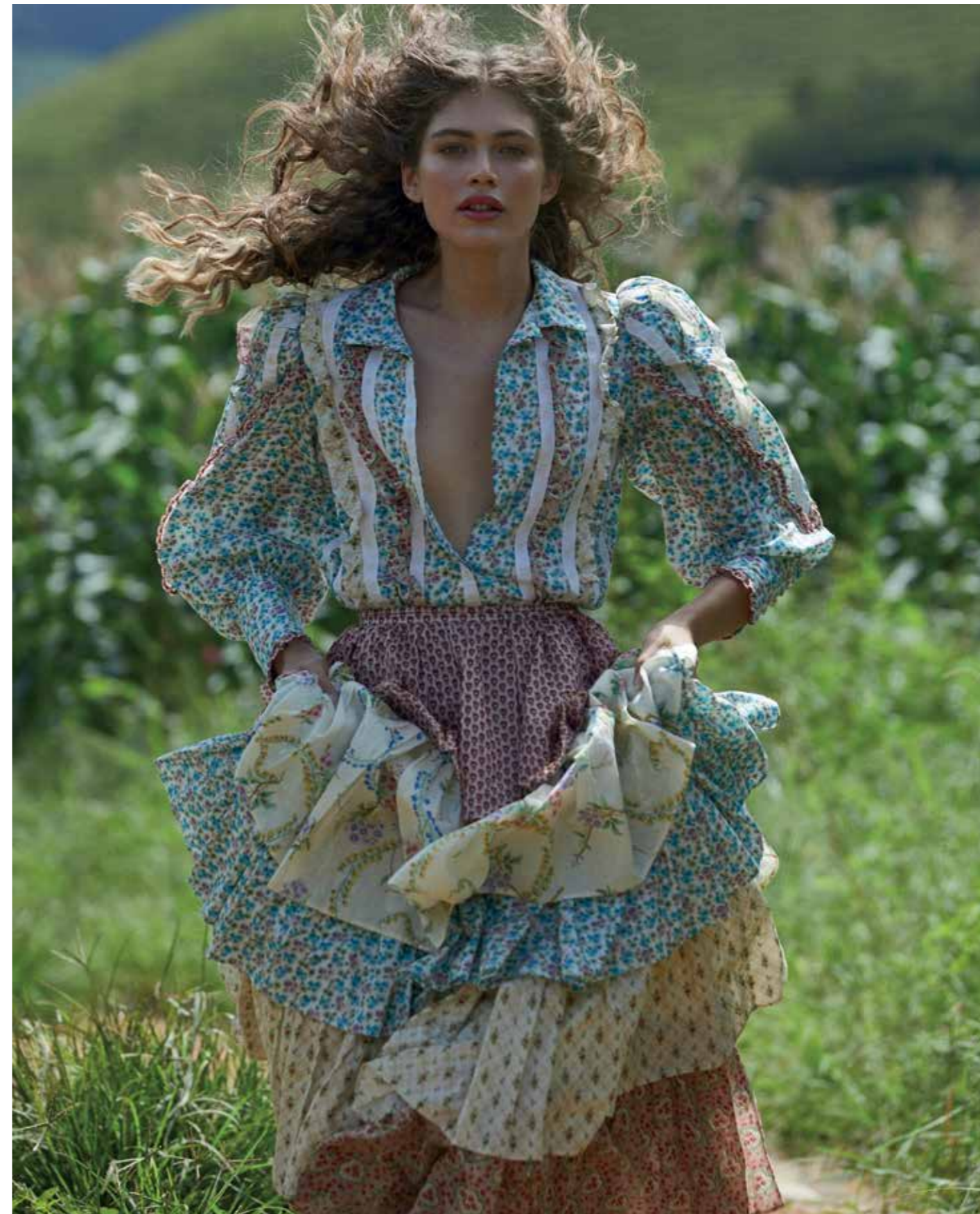
Camisa, R$ 12.000, e saia, R$ 17.000, Gucci