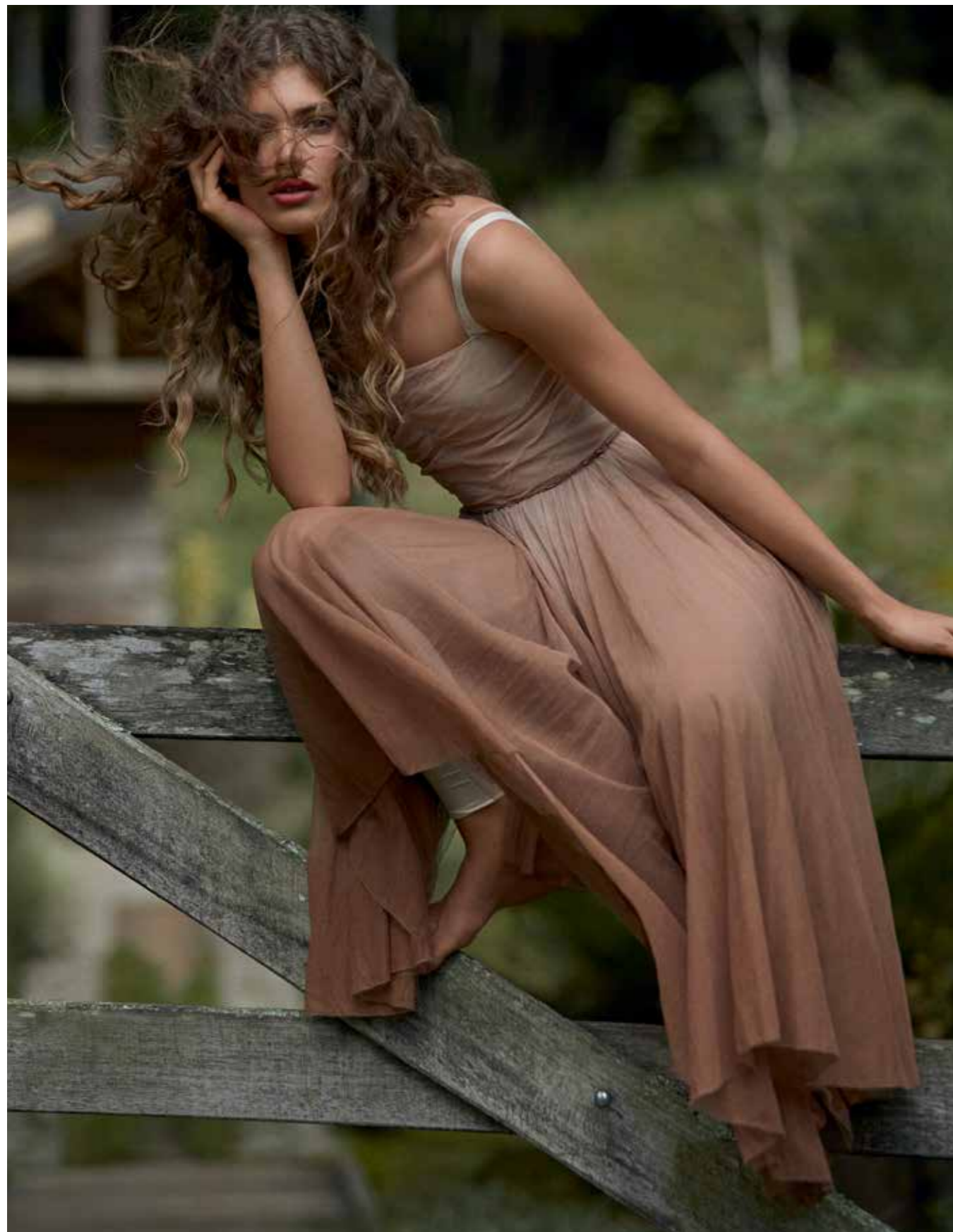
Vestido, R$ 35.000, e macacão, R$ 9.000, Dior