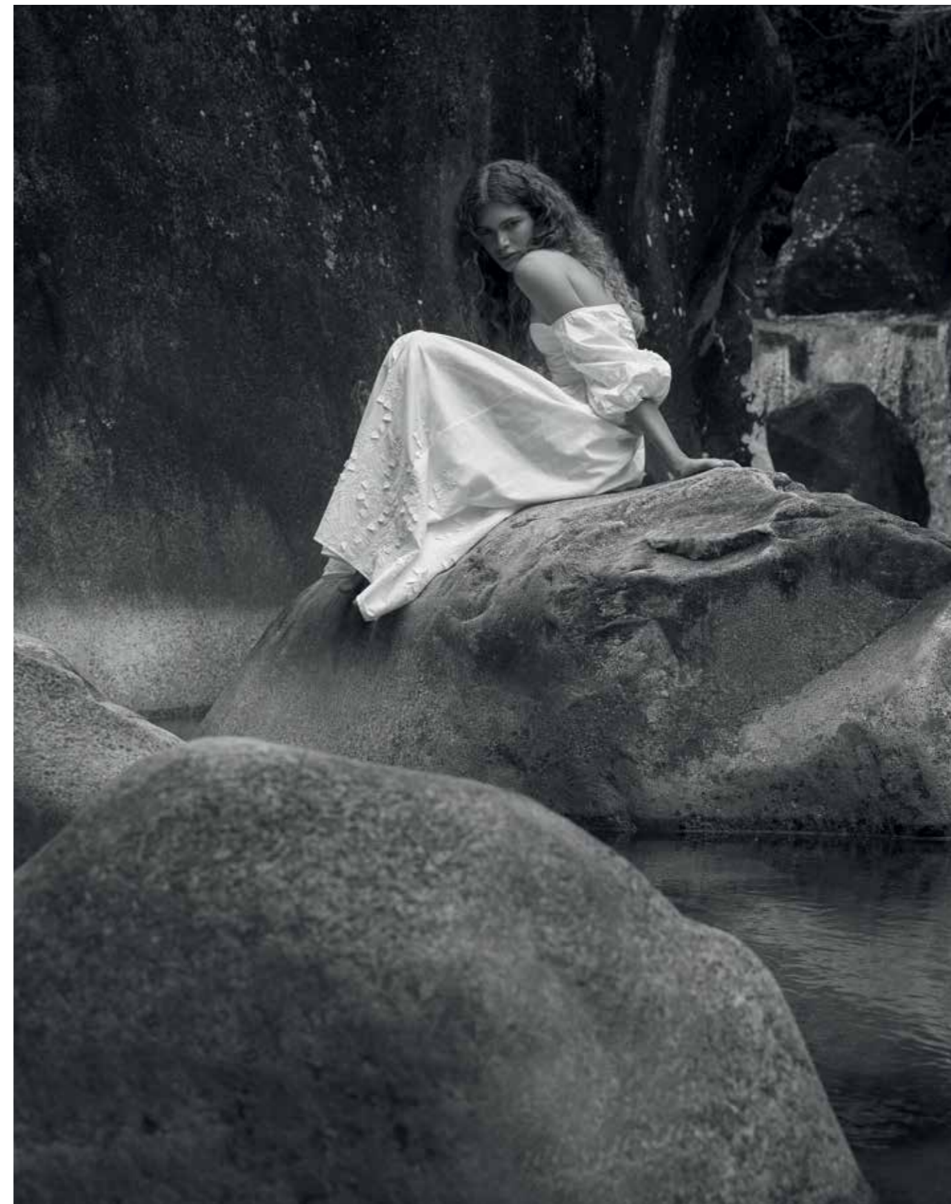
Da esq. para a dir.: vestido À La Garçonne , R$ 2.190. Chapéu Chanel , a partir de R$ 6.040. Vestido Paula Raia , R$ 5.691